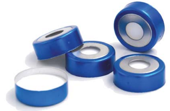
SBC201202 白色硅胶复合红色特氟龙垫片 20mm 银色磁性开口铝盖