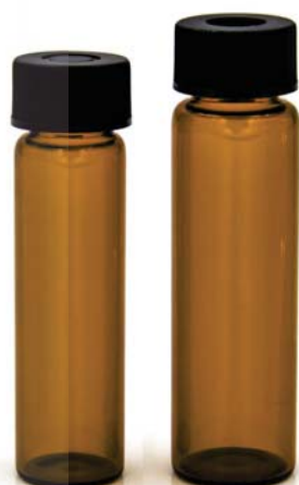
8ml /12ml 棕色样品瓶