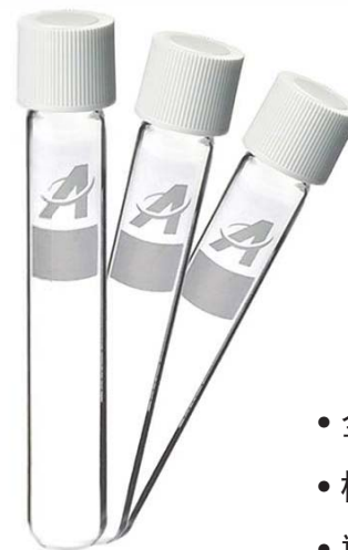
12ml COD消解比色管 有标款