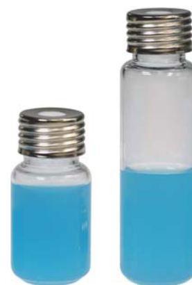
18mm 螺纹透明顶空瓶 VA101 / VA201