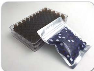
在洁净工作台对货物进行包装