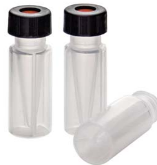
VP91 短螺旋微量透明样品瓶