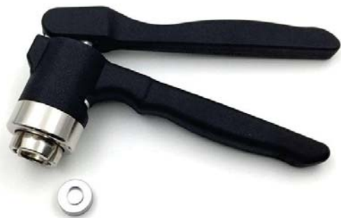
AJRC20-II 钳口密封的塑料模制压盖器