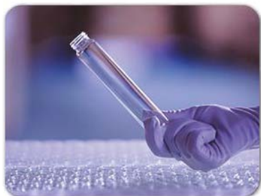
常检货物，挑出瑕疵瓶和盖