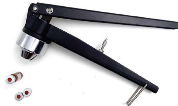
AJRC11 金属电镀型 11mm 钳口样品瓶压盖器