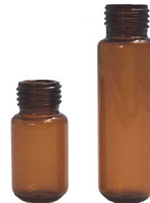
18mm 螺纹透明顶空瓶 VA1035 / VA2035