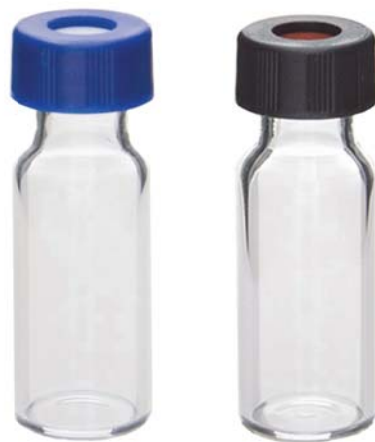
9mm 透明无书写 黑盖样品瓶