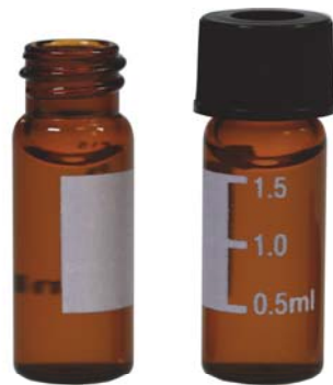
VN1045 棕色宽口螺纹样品瓶 带书写刻度