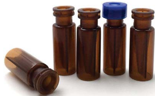
VP103 卡口微量棕色样品瓶