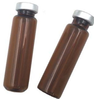
VHR2035 (圆底) / VH2035 (平底) 棕色钳口样品瓶底部区分图