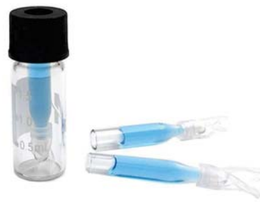
IP150 150ul锥底带支架内插管