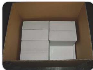
再把小箱放入大箱内