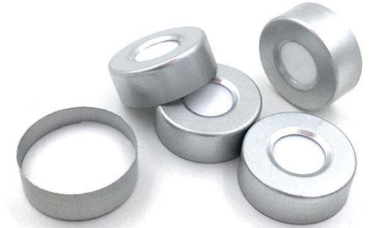
SC201201 白色硅胶复合白色特氟龙垫片 20mm 银色开口铝盖