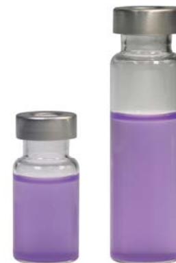
VH1013 / VH2013 透明钳口样品瓶 (平底)