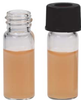
VN1013 透明宽口螺纹样品瓶 不带书写刻度