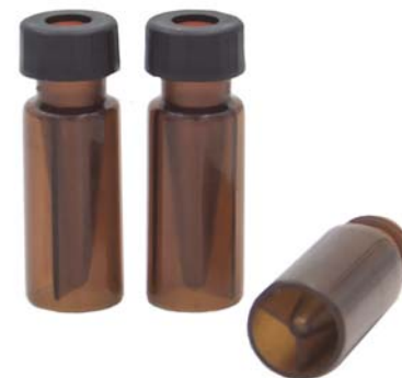
VP93 短螺旋微量棕色样品瓶