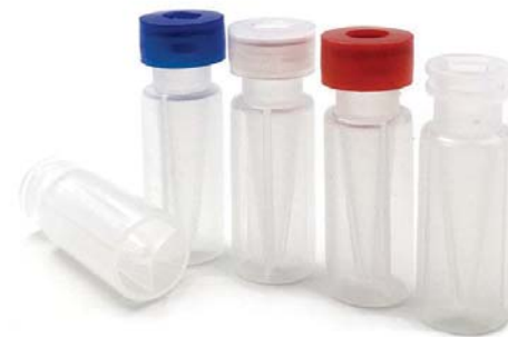
VP101 卡口微量透明样品瓶