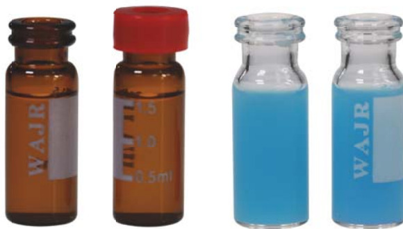
11mm 卡口按盖样品瓶总图