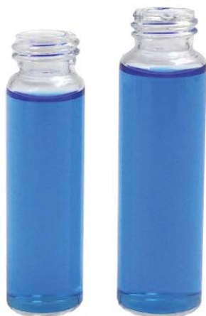
8ml /12ml 透明样品瓶