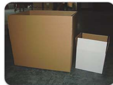
采用无色大小纸箱作为外包装