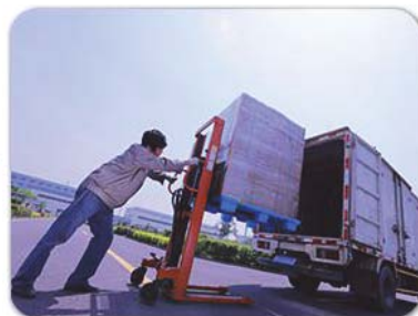
安排物流货车取件