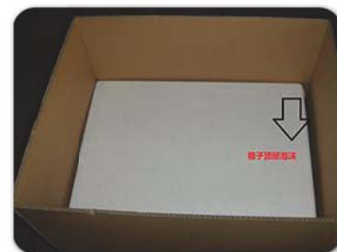
箱子上部再用泡沫层覆盖