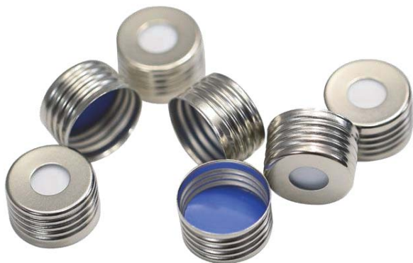
SACA001 白色硅胶复合蓝色特氟龙垫片 18mm银色磁性金属盖