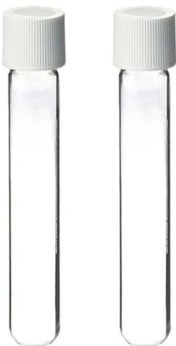
12ml COD消解比色管 无标款