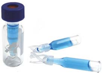
IP250 250ul锥底带支架内插管