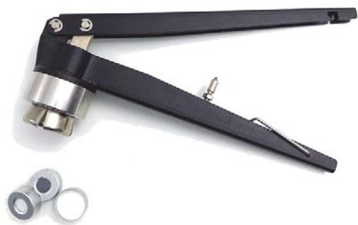
AJRC20 钳口密封的金属制压盖器