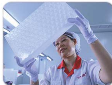
在灯光下检查包装的密封与洁净