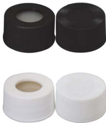
储存瓶盖垫组合总图