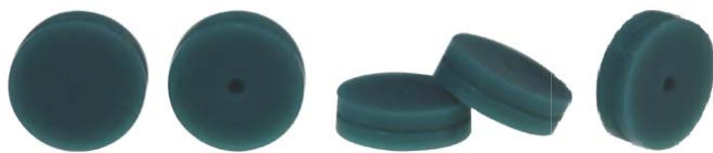
气相色谱分GC 绿色进样隔垫 直径11×3mm，耐温度250℃， 25只/罐