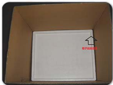
大纸箱下面垫上裁剪过的压缩泡沫