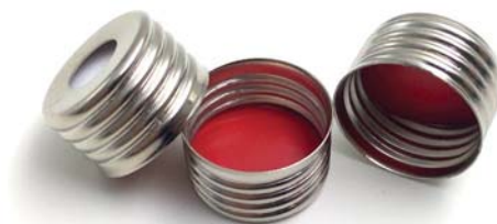
SACA002-II 白色硅胶复合红色特氟龙垫片 18mm银色磁性金属盖