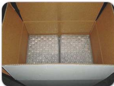
产品先放入定制好的小箱当中